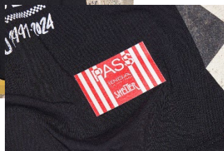
オリジナルスタッフパス▶